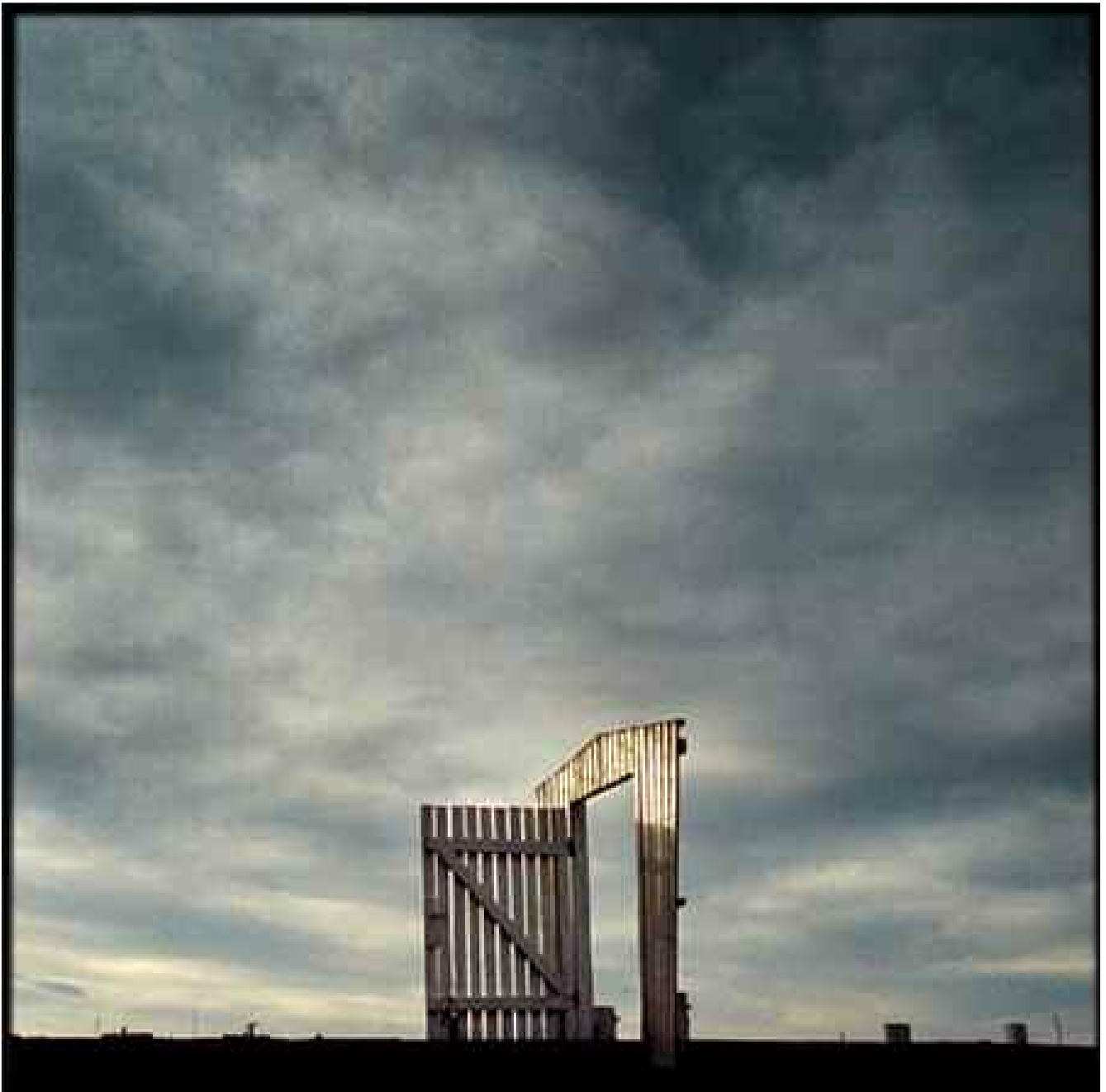
Privat bild från Asperö som Lisa använt som illustration till både kultur och "leva"-sammanhang.