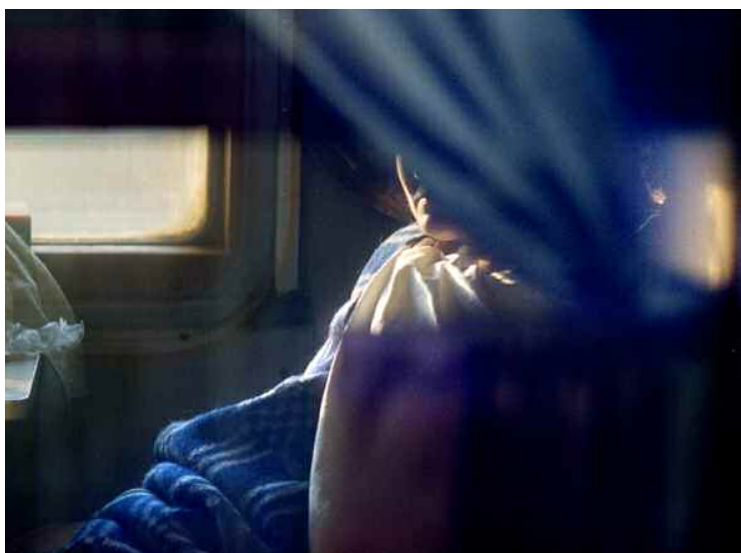
Transsibiriska järnvägen 2003. Den anonyma kvinnan bakom gardinen sitter i ett mötande tåg. Bilden användes bland annat i ett reportage om psykiatri.

– Fotografin behöver jag inte koppla av, men att koppla av jobbet är en annan sak. Och jag har varit borta flera gånger, mammaledig eller tjänstledig. Då är det alltid kul att komma tillbaka igen. 1995–96 var jag tjänstledig och gjorde bara ingenting. Det första jag gjorde var att sätta mig ner och lägga ut ett 2 000-bitars pussel. Det var så skönt att bara landa.