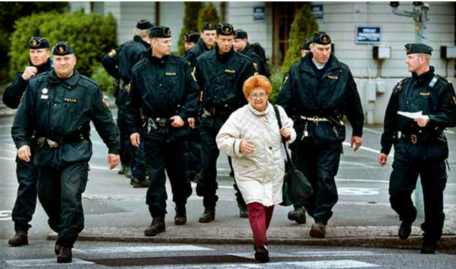
Inför EU-toppmötet. Göteborgs stad var full av glada (!) poliser.