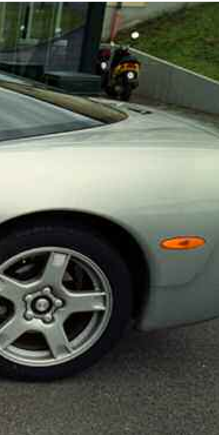
Pojkdrömmar. En ögonblicksbild tagen under en semester i Tylösand.